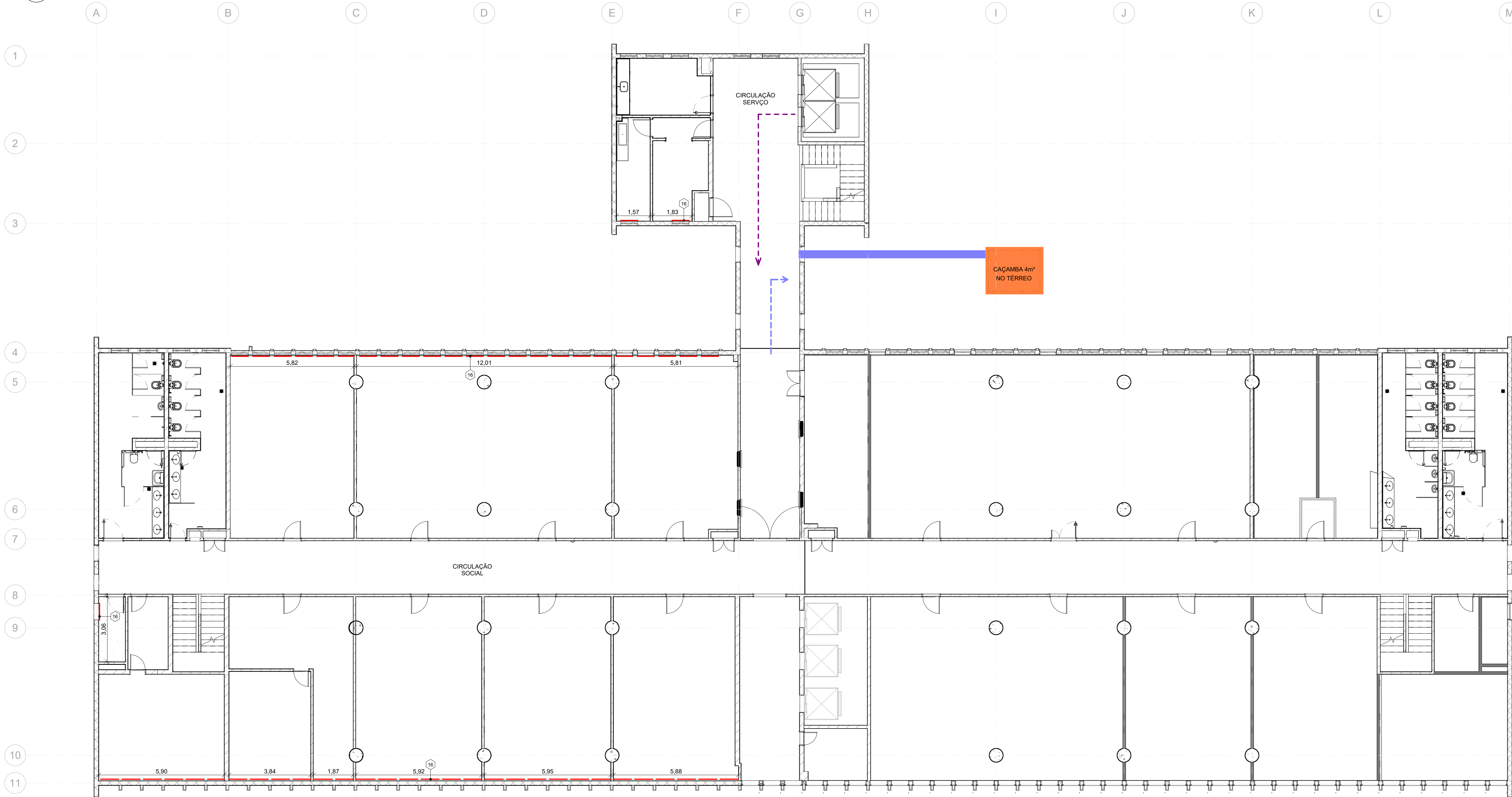
1 PLATAFORMA DE ENSINO - INSTALAÇÕES PROVISÓRIAS ESCALA 1 : 100